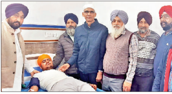
बराड़ा। रक्तदानियों को बैज लगाते एसडीएम व अन्य।

गुरु गोबिंद सिंह के छोटे साहिबजादे बाबा जोरावर सिंह बाबा फतेह सिंह तथा माता गुजर कौर की शहीदी दिवस के उपलक्ष्य में गुरुद्वारा दोसड़का में चल रहे तीन दिवसीय धार्मिक कार्यक्रम में मंगलवार को दूसरे दिन सुंदर पगड़ी, धमाला साहिब, कविता के मुकाबले हुए। अमृत संचार के अतिरिक्त रक्तदान कैंप का आयोजन भी किया गया। बता दें कि हर वर्ष की भांति इस बार भी छोटे साहिबजादे बाबा जोरावर सिंह बाबा फतेह सिंह तथा माता गुजर कौर का शहीदी दिवस श्रद्धा से मनाया जा रहा है। तीन दिवसीय आयोजित कार्यक्रम में गंत 25