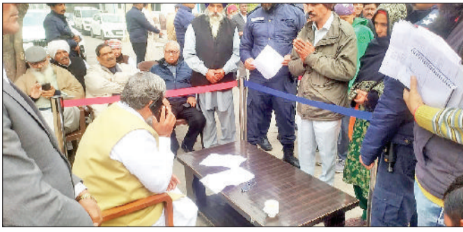
अंबाला। अपने आवास पर लोगों की शिकायतें सुनते गृहमंत्री अनिल विज।

उसके घर में चोरी हो गई थी। इस बारे में उसने पुलिस में शिकायत भी दी थी लेकिन पुकारवाई नहीं हो रही है। गुरुग्राम से आए एक प्राइवेट डॉक्टर ने बताया कि उसने एक प्राइवेट अस्पताल खोला था। जैसे