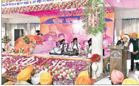
कुरुक्षेत्र। संगत को संबोधित करते मुख्यमंत्री मनोहर लाल।