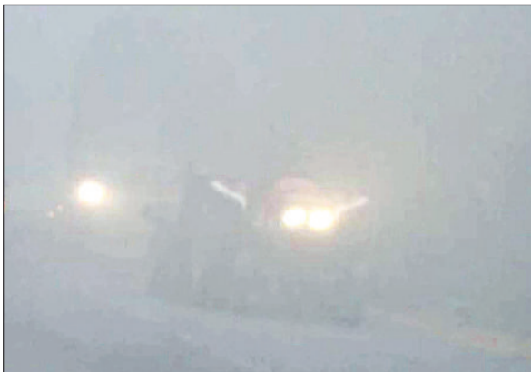
यमुनानगर। मंगलवार को सुबह के वक्त घने कोहरे के बीच सड़कों पर रेंगते वाहन।

मंगलवार अलसुबह तीन बजे से ही शिलें में घना कोहरा छा गया था और शीतलहर चल रही थी। वहीं, दोपहर एक बजे तक आसमान में धुंध के बादल छाए रहे और शीतलहर चलने से मौसम में हाइड्रो टंड बनी रही। दोपहर एक बजे के बाद किसी तरह