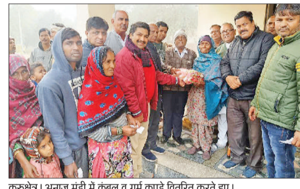
कुरुक्षेत्र। अनाज मंडी में कंबल व गर्म कपड़े वितरित करते हुए।