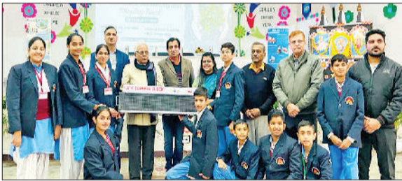
कुरुक्षेत्र। कार्यक्रम में मौजूद स्टाफ व विद्यार्थी।

सीएसआईआर-केंद्रीय वैज्ञानिक उपकरण संगठन चंडीगढ़ द्वारा स्कूली छात्रों एवं शिक्षकों के लिए केंद्रीय वैज्ञानिक तथा औद्योगिक अनुसंधान परिषद, भारत के जिज्ञासा मिशन के तहत ऊर्जा साक्षरता प्रशिक्षण के भाग के रूप में राज्य स्तरीय जलवायु घड़ी संयोजन एवं प्रदर्शन का आयोजन गीता निकेतन आवासीय विद्यालय कुरुक्षेत्र में किया गया। कार्यक्रम के आयोजन में सहयोगी के रूप में एनर्जी स्वराज फाउंडेशन आईआईटी बॉम्बे ने महत्वपूर्ण