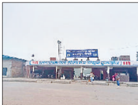
कुरुक्षेत्र। पिपली का बस स्टैंड।

वर्ष 2023 की अब पांच दिन बाद विदाई होने वाली है। इस वर्ष में पब्लिक प्राइवेट पार्टनरशिप (पीपीपी) मोड पर पिपली में आधुनिक सुविधाओं से लैस बस अड्डा बनाए जाने की आस फिर जगी है। सात वर्ष पहले मुख्यमंत्री मनोहर लाल ने पिपली में आधुनिक व वातानुकूलित बस अड्डा बनाए जाने का एलान किया था। इस पर करीब 125 करोड़ रुपये का बजट खर्च होगा। यह बस स्टैंड 10 एकड़ चार कनाल भूमि पर बनाया जाएगा।